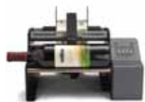
AP362e LABEL APPLICATOR

Les Applicateurs d'étiquette semi-automatique AP-Séries sont la parfaite solution pour les récipients cylindriques et autres formes effilées, tels des bouteilles, bidons, fioles et tubes.