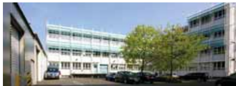
Primera Technology Europe, Allemagne

Primera Technology est un des fabricants leader d'imprimantes spécialisées. Nous avons produit plus d'un million d'imprimantes à transfert thermique, jet d'encre ou matricielle au cours de notre histoire. Vous pouvez être assuré en toute confiance que votre nouvelle imprimante d'étiquettes couleurs Primera vous donnera des années de satisfaction et de performances. Le meilleur de tous, le LX900e livre vraiment résultats professionnels à un prix accessible !