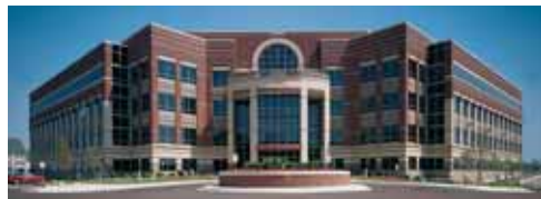
Primera Technology, Inc. É.-U.A.