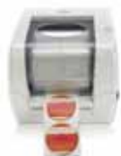
FX400e FOIL IMPRINTER

Le Distributeur d'étiquette de DX850e automatiquement distribue et présente étiquettes auto-adhésives une à une. Il remplace la prise manuelle d'étiquettes, rendant votre chaîne de production plus rapide et plus efficace.